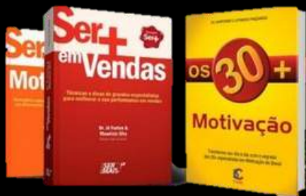
Coautor dos livros