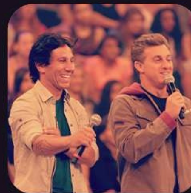
Figura conhecida da TV Globo, Fantástico, Caldeirão, Esporte Espetacular, Domingão e Canal OFF, Luigi une performance, carisma e propósito para entregar uma palestra de alto impacto, que inspira líderes e equipes a tomarem decisões com coragem, enfrentarem riscos com consciência e liderarem com atitude.