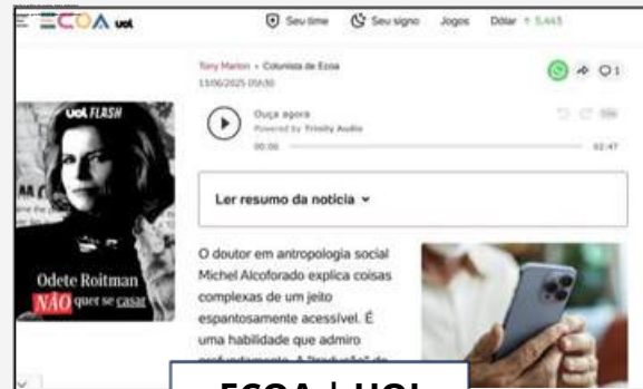
EOA | UOL