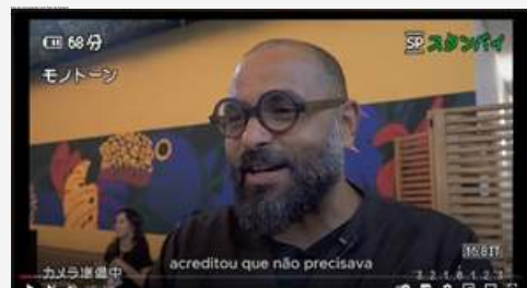
NIKKEI OPENING 2024