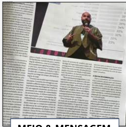
MEIO & MENSAGEM