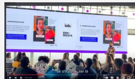
MARKETING DE VERBAÇÃO | IAB 2024