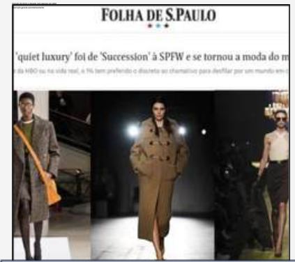
FOLHA DE SÃO PAULO