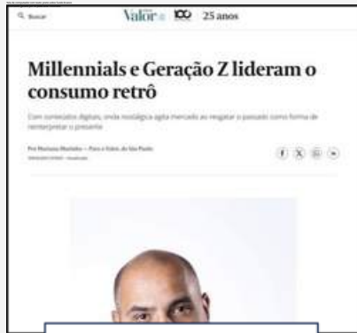
VALOR | GLOBO