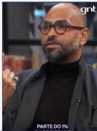
CONVERSA COM BIAL | GNT