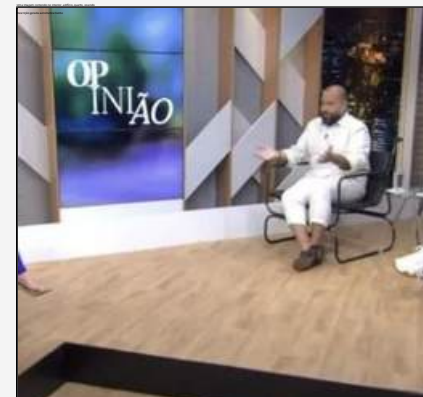
OPINIÃO | TV CULTURA